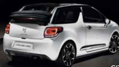
CITROËN DS3 CABRIO