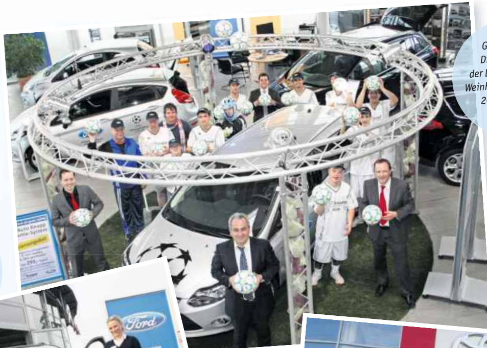
Guter Zweck: Die Kicker von der Lebenshilfe-IKB Weinheim freuten sich 2012 über eine Ballspende.